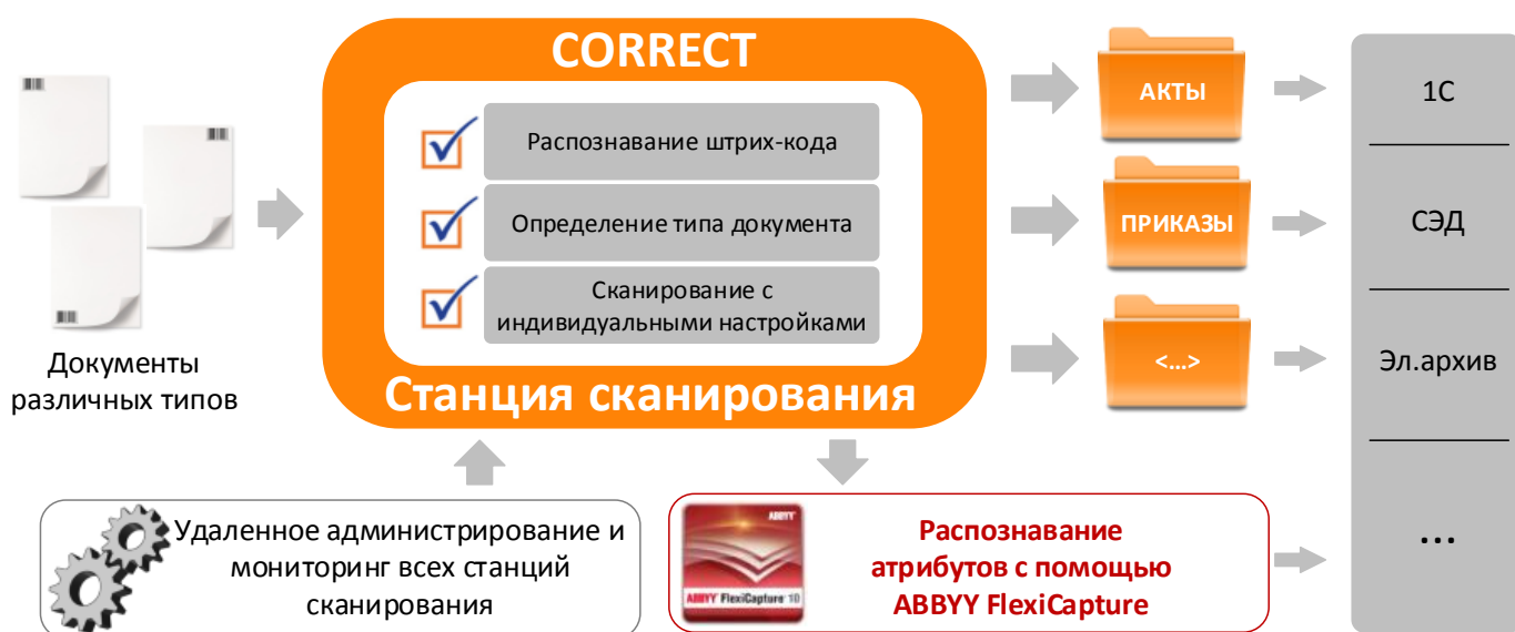
СХЕМА РАБОТЫ СИСТЕМЫ:

Станция сканирования CORRECT – это программное обеспечение для обеспечения работ по сканированию документов. Программа проста в установке и использовании. Она предоставляет гибкие возможности по скоростному сканированию и последующей обработке документов, включающей извлечение штрих-кода и настраиваемую маршрутизацию.